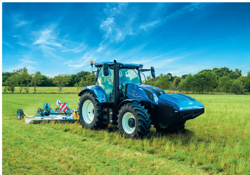
Erstmals zugelassen: Ein New Holland «T6.180» Methane Power.

Der Schweizer Traktorenmarkt ging im vergangenen Jahr markant um rund 20% zurück und ist nun mit 1818 zugelassenen Einheiten deutlich unter die Schwelle von 2000 Stück geraten. Gemäss Aus-