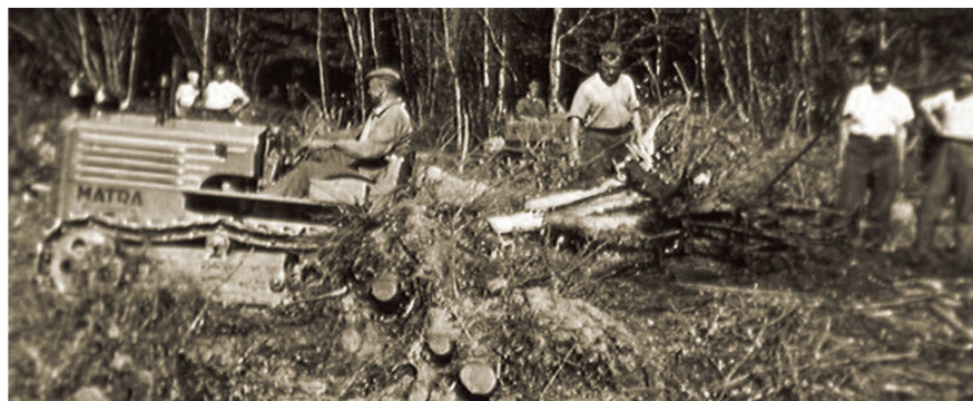
Lavori di bonifica sul Piano di Magadino, nel 1940.

c) La rappresentanza degli interessi dei proprietari delle macchine di fronte al commercio, alle Autorità, alle Società di Assicurazione, ecc.;