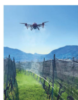
Titelbild: Autonome Technologien werden in Zukunft in der Landwirtschaft immer wichtiger. Auch Drohnen für den Einsatz in Rebbergen können autonom unterwegs sein.