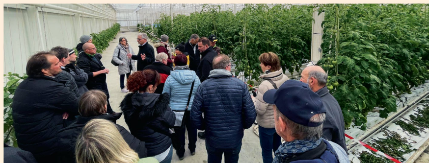
Besichtigung des Tomaten-Gewächshauses. Gutknecht Gemüsebau bietet eine grosse Auswahl an Tomaten- und Gemüsesorten aus eigener Produktion an – auch im Hofladen.