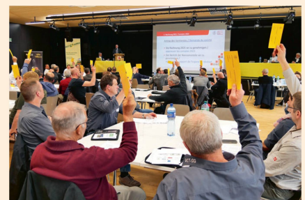
Die Delegierten stimmten allen Anträgen zu.