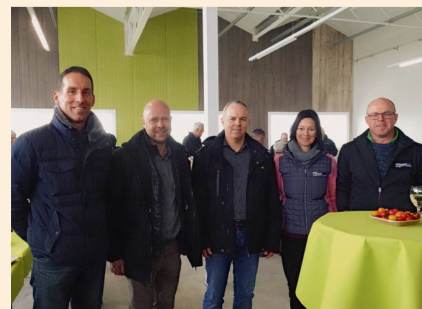
Nach der Führung durch die Seeländer Gemüse-Betriebe wartete ein Apéro.