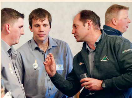
Die Schaffhauser Delegation in engagierter Diskussion.