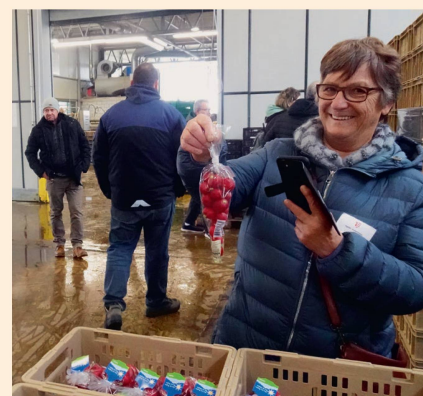
Konnte man mitnehmen: Frische Radieschen.