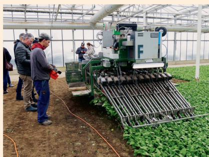
Die Spezialmaschine erntet und bündelt die Radieschen in einem Arbeitsgang.