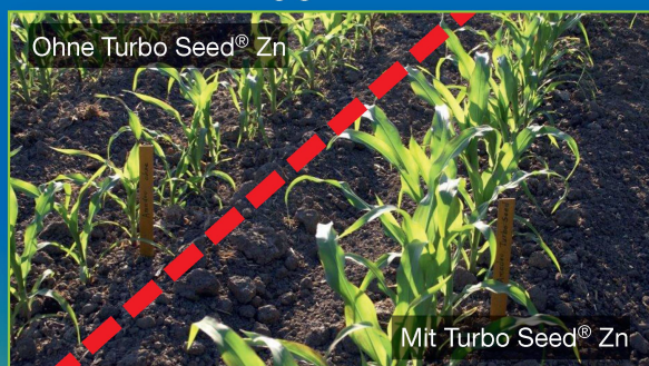
Anwendung in Saatreihe (Mikrogranulator)