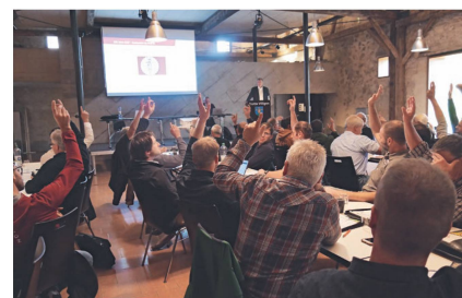
Die Kaderkonferenz fand nach 2021 zum zweiten Mal in der Trotte Villigen statt.

toren mit einem Einleitungs-Bremssystem (H1L) angehängt werden dürfen, werde vom Astra definitiv am 31. Dezember 2025 aufgehoben. Danach sei diese Kombination nicht mehr erlaubt, sagte Engeler. Beim Schleppschlauch-Obligatorium, das 2024 eingeführt wird, gibt es nach wie vor Unklarheit darüber, welche Ausbringsysteme die Vorgaben der Luftreinhalteverordnung erfüllen und welche nicht. Das betrifft vor allem neue Systeme.