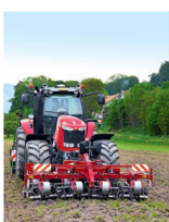
Titelbild: Beim Maschinenkauf ist die Kostenfrage nicht mit der Bezahlung des Anschaffungspreises erledigt. Über die Wirtschaftlichkeit der Maschinen entscheidet auch die Auslastung.