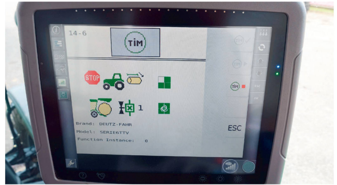
(Bild links): Der aktuelle Verbindungsstatus zwischen Traktor und Rundballenpresse. Die einzelnen Zugriffe der Presse müssen einmalig vom Fahrer freigegeben werden. (Bild rechts): Die «TIM»-Benutzeroberfläche am Traktorterminal.

lenauswurf kann das Risiko für diesen Mehraufwand reduzieren, was sich unmittelbar auf die Tagesleistung des eingesetzten Gerätes auswirkt.