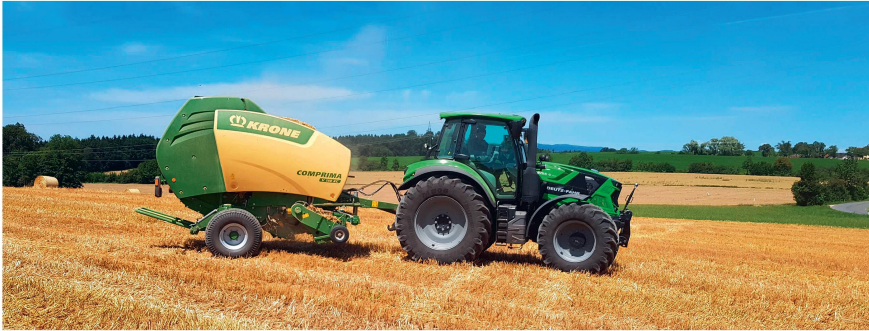
Dieses «TIM»-taugliche Gespann aus Deutz-Fahr «6155.4 TTV» und Krone «Comprima V150 XC» wurde für diesen Versuch eingesetzt.