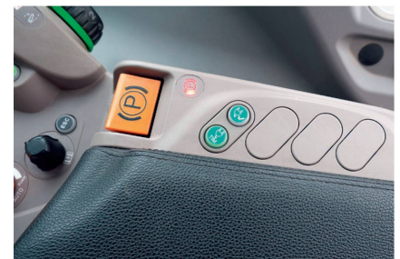
Die Aktivierungstaste für die «TIM»-Steuerung auf der Armlehne des Traktors.

Unter den bereits beschriebenen Versuchsbedingungen betrug die Zeit für den gesamten Press-, Binde- und Ablage-