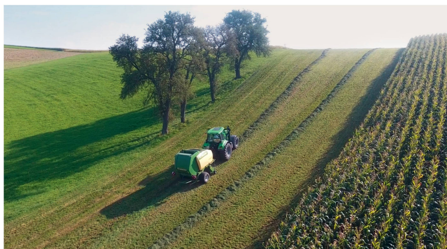
Am Hang erfolgt die Ballenablage wie gewohnt nur auf der Kuppe oder beim Einknicken der Presse über 90° (sodass das Heck leicht hangaufwärts schaut).

Der Aufpreis der «TIM»-Funktion an der Presse beträgt 685 Euro (rund Fr. 750.–*) für die Software und weitere 705 Euro (rund Fr. 780.–) für den Ballenauswerfer, in Summe also rund zwei Prozent vom Gesamtlistenpreis (alle Preise exkl. MwSt.). Wenn beim Traktor davon ausgegangen wird, dass alle anderen Voraussetzungen, wie beispielsweise ein stufenloses Getriebe, ohnehin angeschafft werden, fallen für Iso-