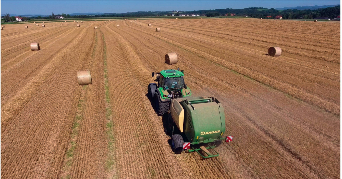
Ein «Tractor Implement Management»-System (TIM) greift auf die Arbeitsabläufe des Traktors zu. Im Beispiel der Rundballenpresse wird der Traktor angehalten und die Ballenkammer sowie der Ballenauswerfer bedient.