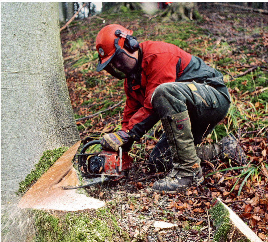
Nur schnell dem Nachbar beim Holzen aushelfen geht ohne Kurs nicht mehr. Auch familienfremde Mitarbeitende müssen den Holzerntekurs absolvieren.