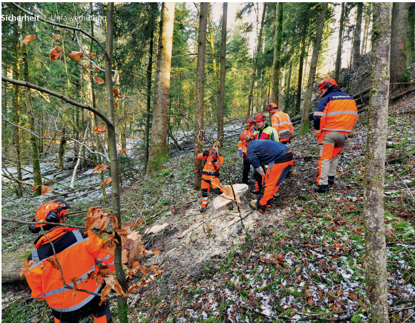
Alle Personen, die im Auftragsverhältnis Waldarbeiten ausführen, müssen ab 1. Januar 2022 eine mindestens zehntägige Ausbildung absolviert haben.