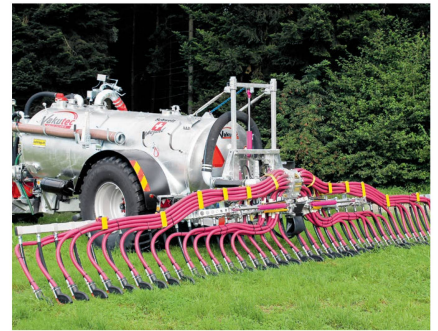
Den Fass-Schleppschuhverteiler «Starrpack» gibt's in Arbeitsbreiten von 7 und 9 m.

Das Aushängeschild ist die Ausbringtechnik, angefangen mit Güllefässern der Marke Vakutec über Schleppschlauchverteiler, Fassverteiler, Schlauchhaspel, Elektroverteiler und Pralltellerverteiler bis zu Bewässerungsanlagen. Der Kreis zur