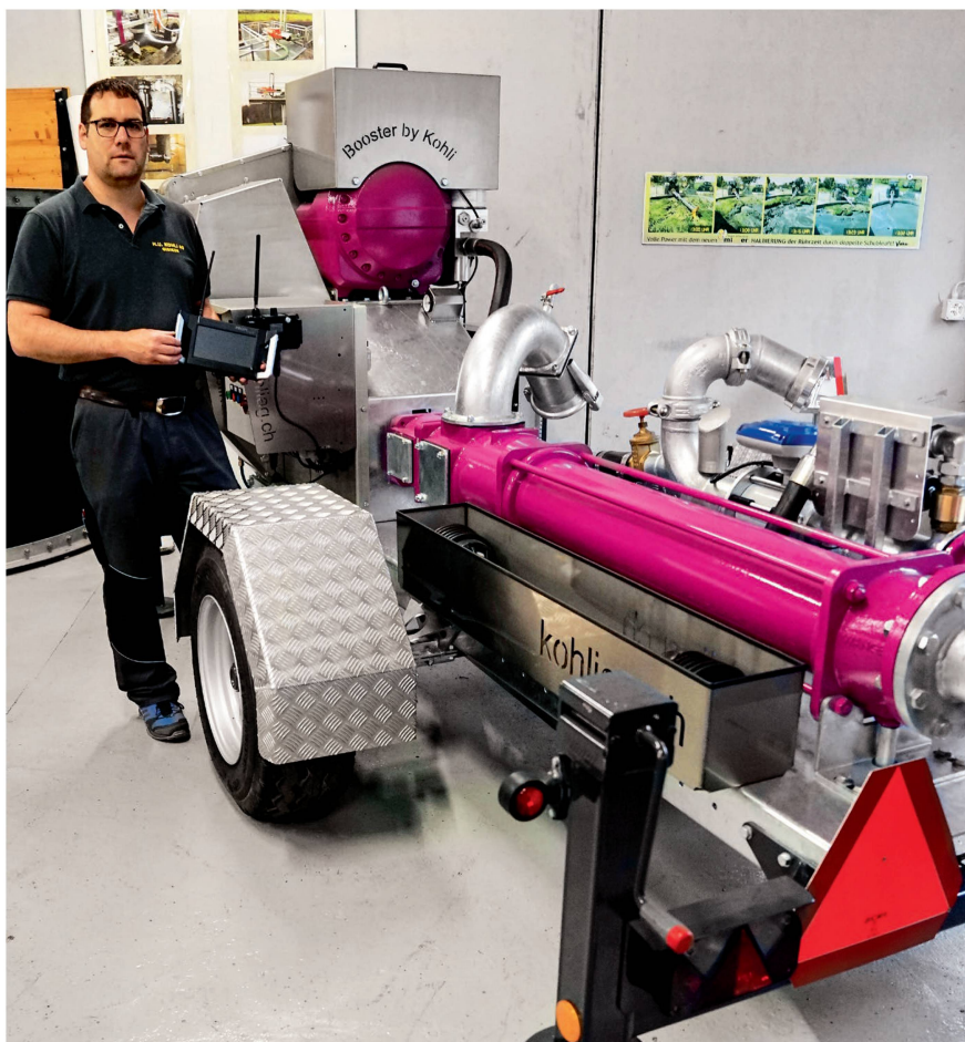
Kohlis Schneckenpumpen sind für härteste Beanspruchung gebaut, hier ausgestattet mit einem Booster der Marke Eigenbau zum Ausblasen der Verschlauchung mittels Luft.

Komplettanbieterin der Firma in Gülletechnik schliesst sich mit den Angeboten an Biogastechnik, Zubehör und Leitungsbau.