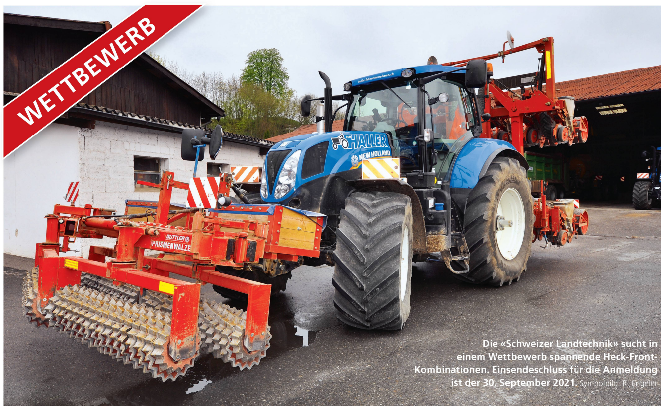
Die «Schweizer Landtechnik» sucht in einem Wettbewerb spannende Heck-Front-Kombinationen. Einsendeschluss für die Anmeldung ist der 30. September 2021.