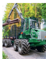
Titelbild: Holz rücken mit einem Forwader des Typs «1250F» von Gremo: Dank gestiegener Holzpreise wird die Arbeit im Wald wieder wirtschaftlicher.