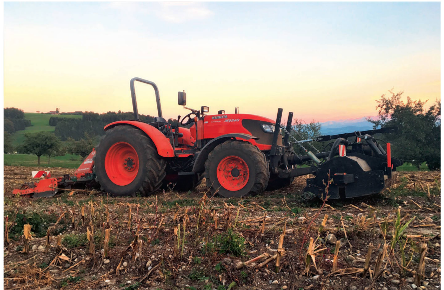
Der Kubota fällt durch seine eigenwillige kompakte Bauform auf.

Zu alledem erlaube das Fehlen einer Kabine eine fast perfekte Rundumsicht. Weil der 90-Liter-Tank unter dem Fahrersitz eingepasst ist, fällt die Motorhaube des Traktors nicht allzu wuchtig aus und erlaubt präzises Anfahren an die Anbaugeräte. Kurz: «Der