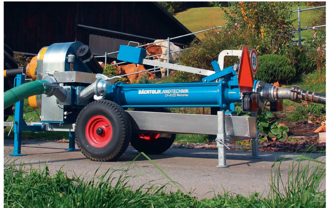
Die Bächtold-Schneckenpumpen werden in Menznau komplett mit Chassis, Steuerung und Antrieb auf Kundenwunsch ausgestattet.

gie werde direkt genutzt, anstatt damit eine Hydraulikpumpe zu betreiben, welche ihrerseits wiederum den Hydraulik-Fahrmotor antreibt. Die kinetische Energie, die durch das Abbremsen frei werde, müsse folglich beim hydraulischen System komplett in Wärme umgewandelt werden. Beim «PowerDrive+» werde diese Energie jedoch ins Netz zurückgespeist. «Der Einsatz eines Elektro-Fahrtriebs mit Energie-Rückgewinnung an einem Heukran ist neu. Und das Gute daran: Die Technik ist nicht nur bei neuen Anlagen erhältlich, es können auch bestehende Bächtold-Heukräne damit nachgerüstet werden», so Wittwer.