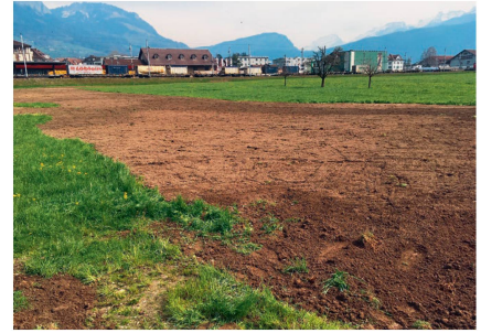
Beispiel einer gelungenen Rekultivierung mit vermitteltem Boden.