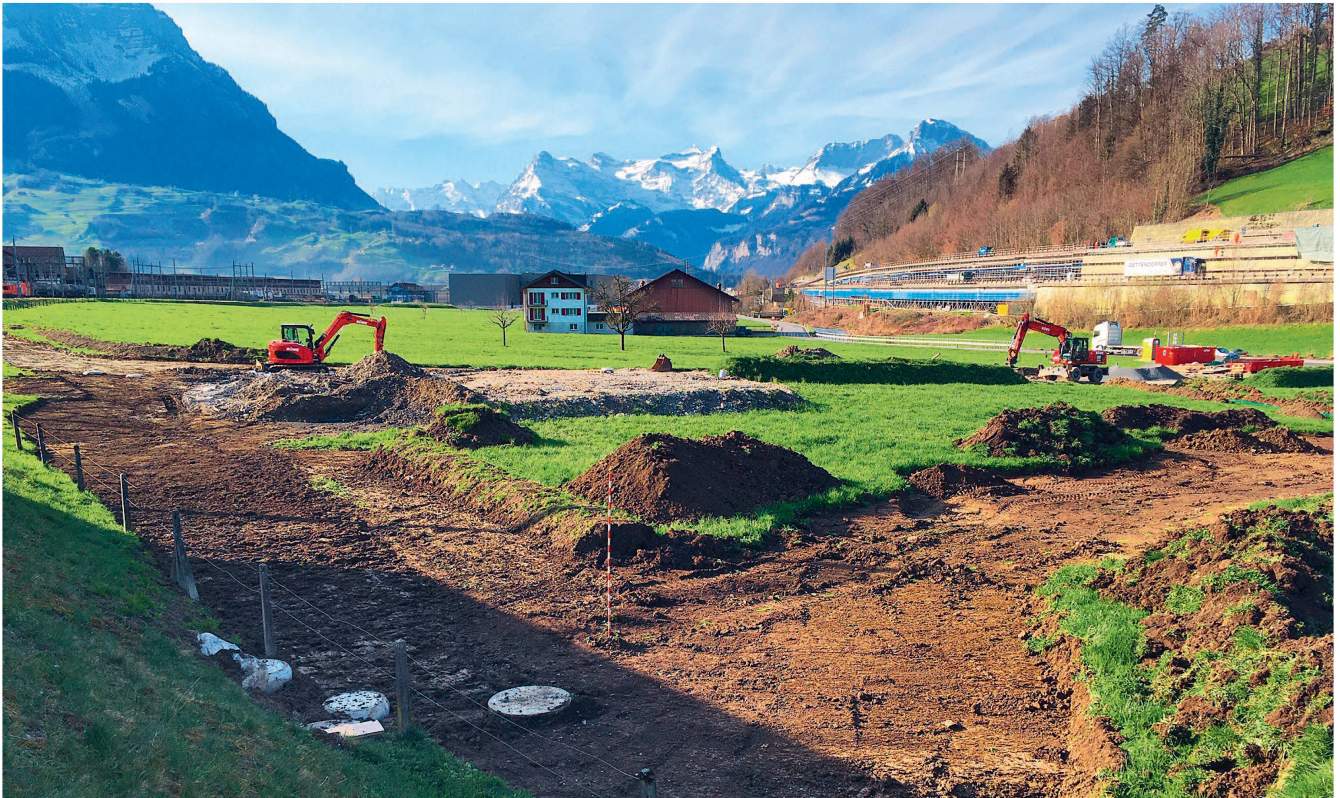
Bauprojekte werfen meist überschüssigen Boden ab, der anderswo für Aufwertungen und Rekultivierungen fehlt.