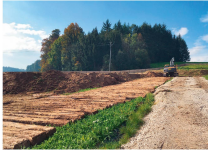
Aufbau eines Bodendepots für die spätere Wiederverwendung.