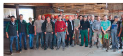
Die 30 Landwirte der Maschinengemeinde Rheinklingen besitzen gemeinsam 45 Maschinen und verwenden dazu «FarmX».

«FarmX» ist eine Schweizer Plattform für den Austausch von landwirtschaftlichen Maschinen. Die Plattform wurde in Zusammenarbeit mit Landwirten und diversen Maschinengemeinschaften entwickelt und vor dem Live-Gang getestet. Seit Mitte Februar ist das Tool, das als App via Smartphone, aber auch übers Internet am PC benutzt werden kann, online. Ursprünglich vom jurassischen Bauernverband mit Unterstützung des Bundesamts für Landwirtschaft initiiert, wird «FarmX» heute von zahlreichen Partnern unterstützt und weiterentwickelt, darunter sind der Schweizerische Verband für Landtechnik (SVLT) und die Maschinenringe Schweiz.