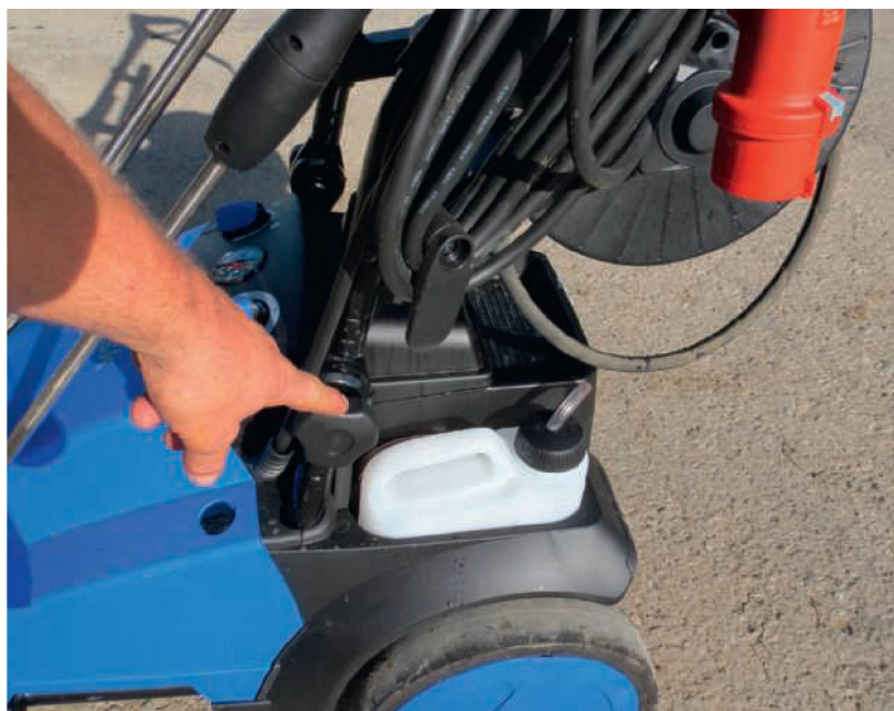
Für die Beimischung von Reinigungsmitteln stehen zwei separate Tanks bereit, die kompakt ins Gerät integriert sind.