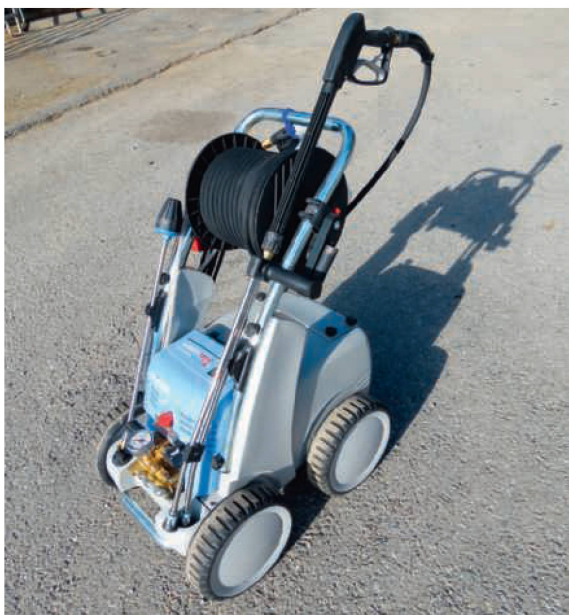
Der «Quadro 1200TST» von Kränzle ist mit bewährter und grösstenteils selbst gefertigter Technik ausgestattet.