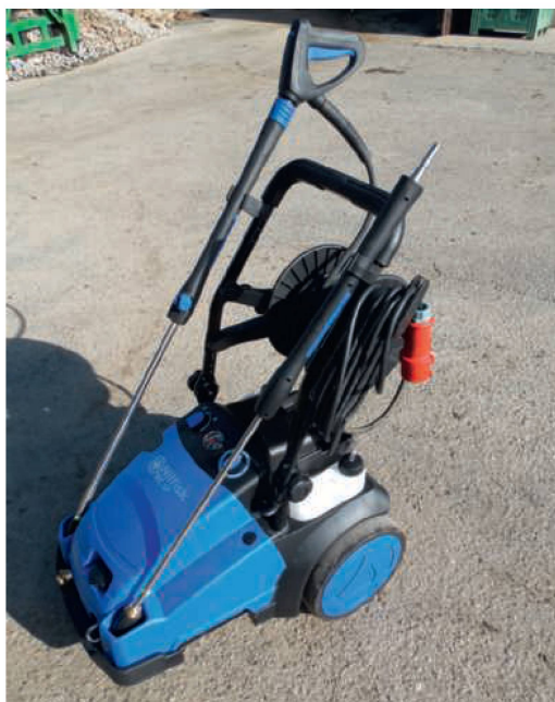
Der «MC 6P-200/1050 XT» von Nilfisk verfügt über eine solide und modern gestaltete Verschalung.