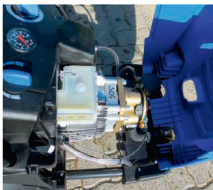
Der Nilfisk «MC 6P-200/1050 XT» ging als Einziger mit einer 4-Kolben-Axialpumpe in den Test.

Der «MC 6P-200/1050 XT» von Nilfisk ist ein kompakter und wendiger Hochdruckreiniger. Eine solide und modern gestaltete Verschalung schützt das Innenleben vor Schmutz und Wasser, lässt sich zudem nach kurzem Entriegeln mit einem Schraubenzieher oder einer Münze schnell und einfach nach vorne klappen. Das Gerät passt dank dem werkzeuglos klappbaren Schiebebügel durchaus auch in den Kofferraum eines Autos. Der Bügel ist massiv gefertigt, lässt sich mit zwei grossen Rändelschrauben lösen und mit der befestigten Schlauchrolle einfach abklappen. Auf beiden Seiten des Chassis ist je ein praktischer Haltegriff für den Verlad und Transport montiert.