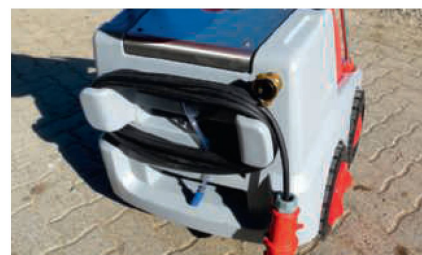
Das Kabel kann hinten am Gerät schnell und sauber verstaut werden.

Angenehm ruhig ist der Geräuschpegel während der Arbeit. Prima sind die Schnellkupplungen für die verschiedenen Lanzen. Sie lassen sich zügig tauschen,