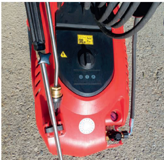
Der «P-KW 1300-200» von Moog ist so konfektioniert, dass die Anforderungen in der Landwirtschaft gut abzudecken sind.