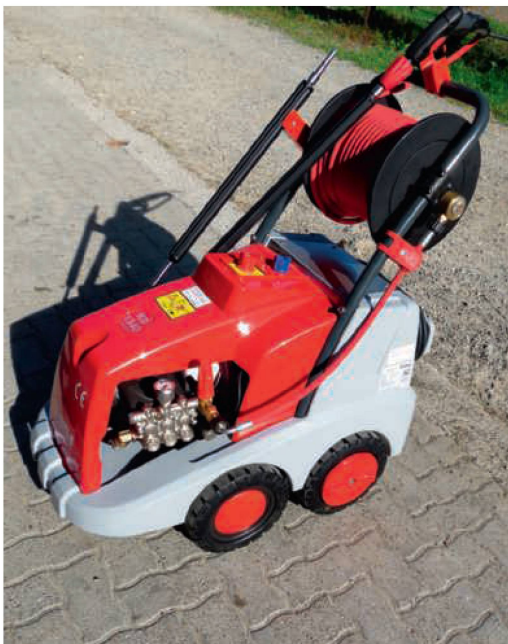
Der «KD1340 Premium» von Ehrle kommt in modernem Design daher.