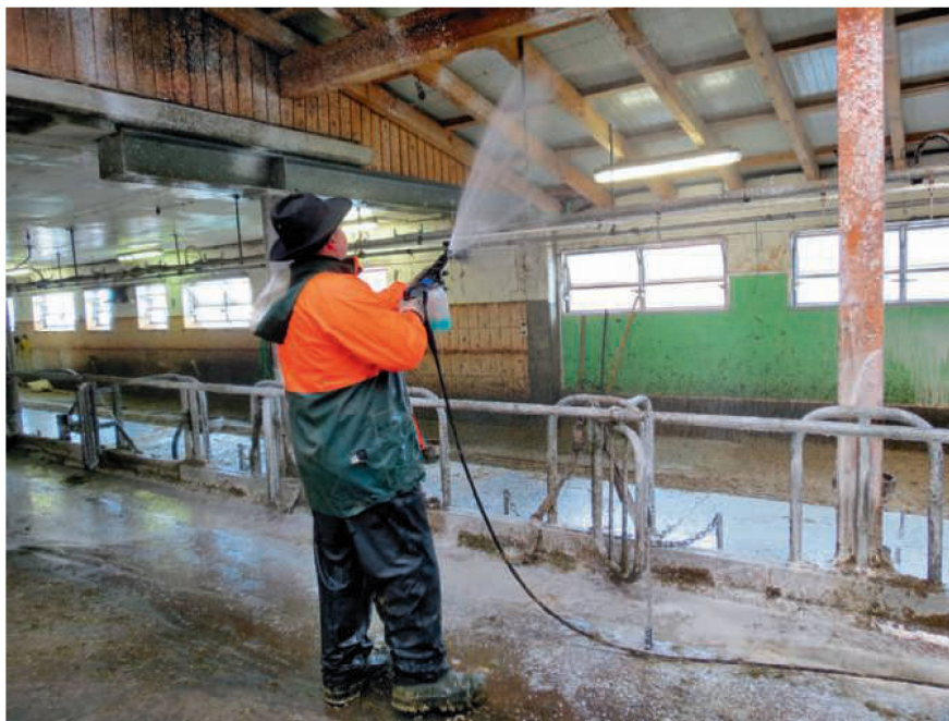
Spezielle Lanzen mischen vor dem Sprühkopf zusätzlich viel Luft dazu, so dass eine grosse Menge an zähfliessendem Schaum entsteht.