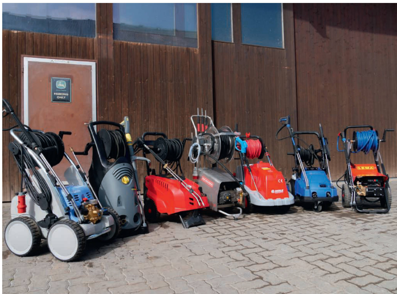
Rund vier Wochen standen sieben Kaltwasser-Hochdruckreiniger der Profi-Klasse von ebenso vielen Marken für einen harten Praxistest im Einsatz.