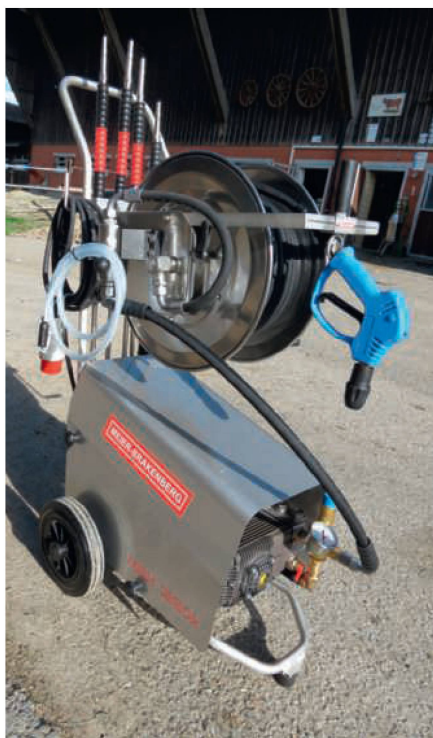
Edel in Chromstahl, aber trotzdem funktionell: «MBH 1260K» von Meier-Brakenberg.