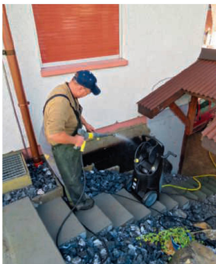
Die Manövrierfähigkeit ist ein Kriterium, gerade wenn man in unwegsamer Umgebung arbeitet.