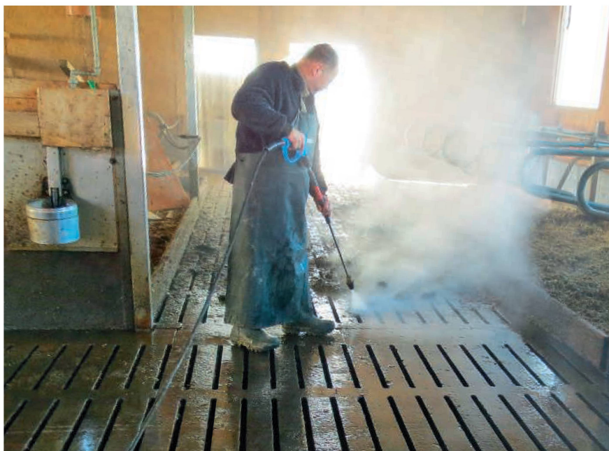
Arbeiten mit dem Dreckfräser im Laufstall.