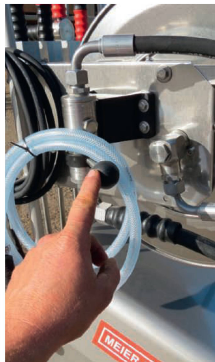
Leitungen und Zubehör ab Pumpe sind gut aufeinander abgestimmt.