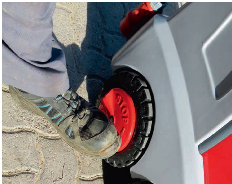
Am Tandemfahrfwerk ist an der Hinterachse auf jeder Seite eine griffige Bremse integriert.