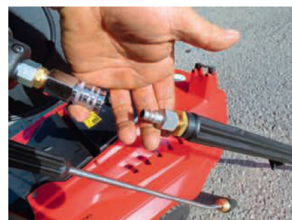
Sinnvoll gelöst: das kleine Staufach für Kleinmaterial.

fessionellen Gebrauch etwas knapp ausgelegt, funktionierte im Test aber. Vorne an der Doppellanze würde ein Düsenschutz gute Dienste tun. Für eine Lanze gibt es eine Halterung und für das Elektrokabel sind auf dem Schiebebügel passende Halterungen angebracht.