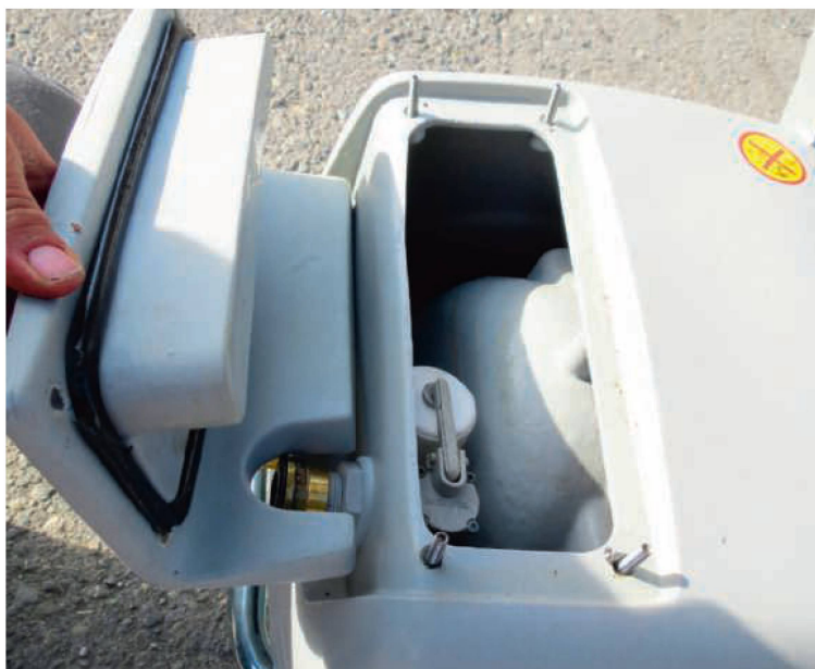
Im hinteren Teil des Chassis befindet sich der Schwimmertank mit einem Fassungsvermögen von 16 l.