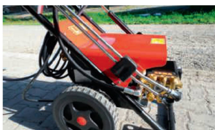
Auf dem Rohrrahmen ist auch gleich die Schlauchrolle montiert.

Auf dem Rohrrahmen ist gleich die Schlauchrolle montiert. Leider kann Wasser in das Innere der Hohlprofile dringen, und die füllen sich mit der Zeit. Ablassbohrungen könnten hier Abhilfe schaffen. Als schlichte Abdeckung ist ein Schutzblech über die ganze Technik montiert. Rund-