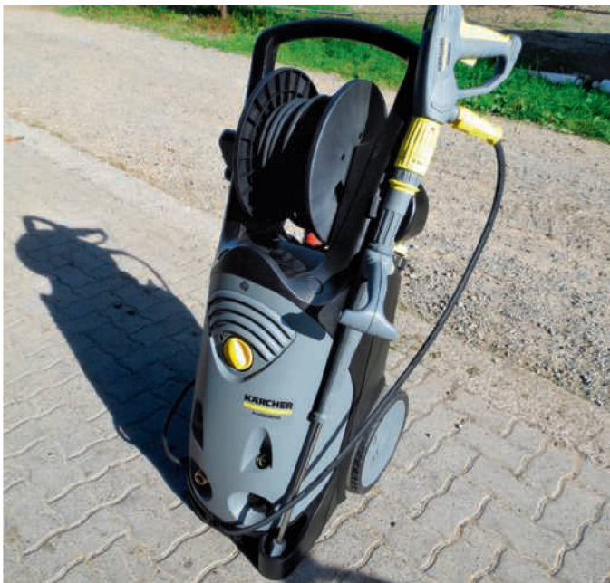
Mit den kompakten Massen ist der Platzbedarf des Kärcher «HD 13/18-4 SX Plus» gering.