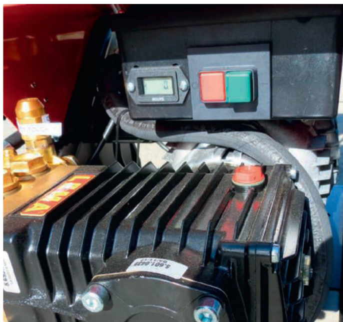
Als einziges Gerät im Test verfügt der Hochdruckreiniger von Lema über einen Stundenzähler.