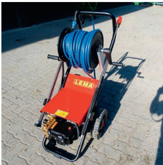
Beim Lema «Red Power P21/200» trägt ein hochgezogener Rohrrahmen das Chassis auf den zwei gross dimensionierten Rädern.