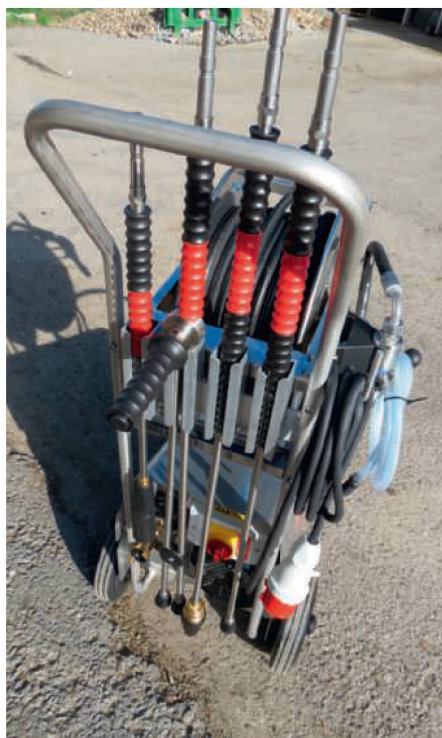
Vorbildlich sind die Halterungen für die Lanzen und das Kabel.