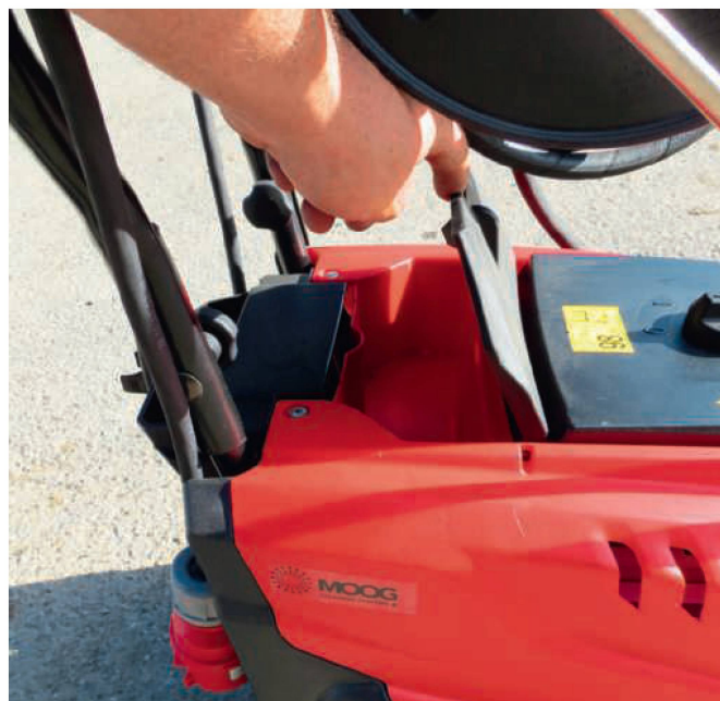
Das Schnellkuppelsystem mit kurzen und eher gering dimensionierten Steckkupplungen funktionierte im Test.