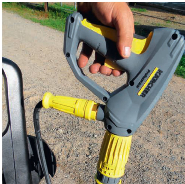
Zur Ausrüstung zählt die spezielle «EasyForce»-Pistole mit Druckverstellung.