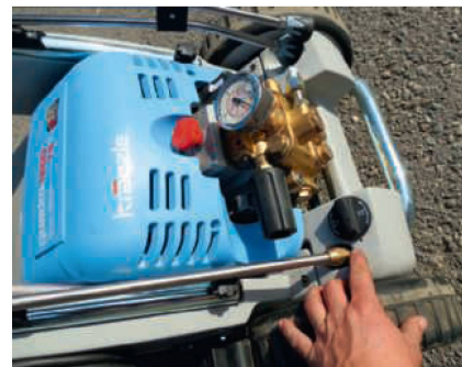
Auf der ausserhalb der Verschaltung montierten Pumpe ist ein Druckregler vorhanden.

Schnellwechselsystem im Betrieb hatte, möchte dieses nicht mehr missen. Auf beiden Seiten gibt es einen Lanzenhalter, der die Bauteile ordentlich an Ort und Stelle hält. Super gelöst ist die seitliche Kabelhalterung.