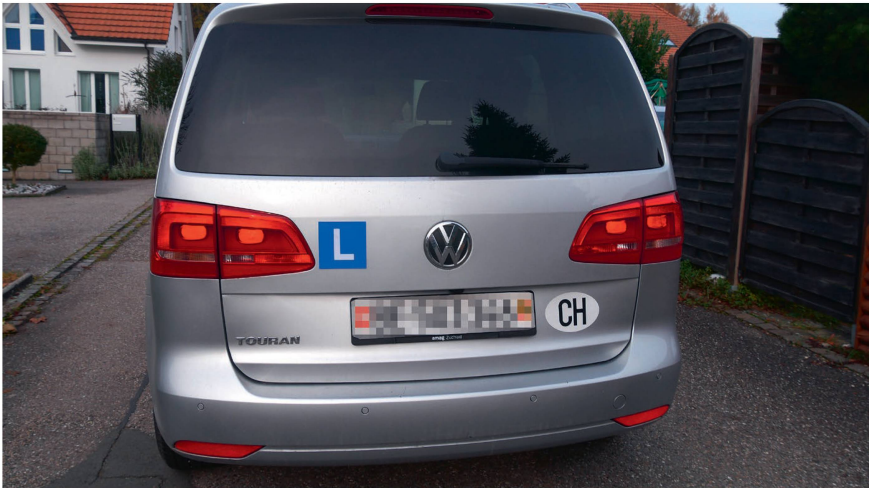
Der Auto-Lernfahrausweis wird ab dem Jahr 2021 bereits im Alter von 17 Jahren erteilt. Die Lernphase mit Begleitung dauert dann neu zwölf Monate.