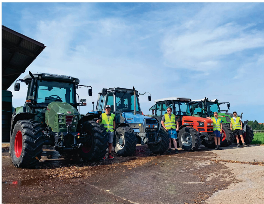
BUL und SVLT wollen intensiver zusammenarbeiten – insbesondere im Kurswesen.