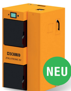
Zyklotronik XV, 20–30 kW