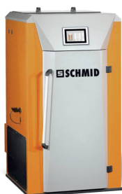
Lignumat UTSL, 30–250 kW