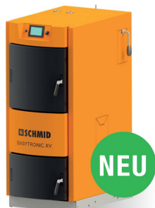
Easytronic XV, 15–30 kW