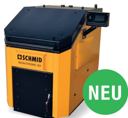
Novatronik XV, 30–80 kW Halbmeter / Meter