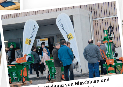
Eine grosse Ausstellung von Maschinen und Geräten vor dem Versammlungslokal.