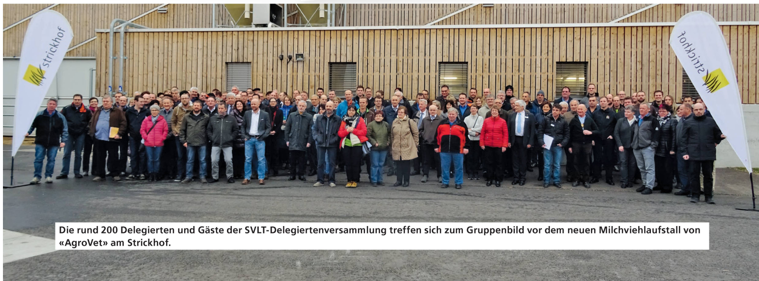
Die rund 200 Delegierten und Gäste der SVLT-Delegiertenversammlung treffen sich zum Gruppenbild vor dem neuen Milchviehlaufstall von «AgroVet» am Strickhof.