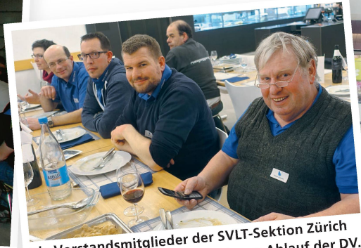
Die Vorstandsmitglieder der SVLT-Sektion Zürich freuen sich über den reibungslosen Ablauf der DV.