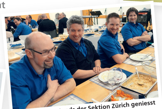
Ein Teil des Vorstands der Sektion Zürich geniesst beim Nachtessen eine organisatorische Pause.