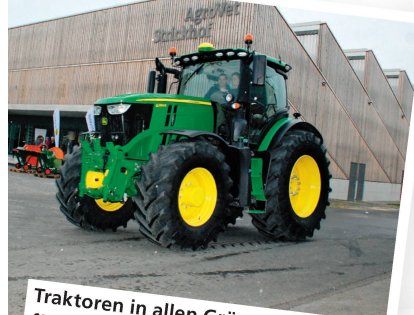
Traktoren in allen Grössen standen für Probefahrten zur Verfügung.