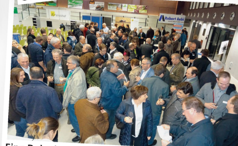
Eine Delegiertenversammlung bietet immer auch Gelegenheit für den persönlichen Austausch.