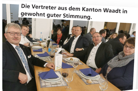
Die Vertreter aus dem Kanton Waadt in gewohnt guter Stimmung.