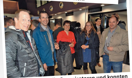
Waren im Vorjahr die Organisatoren und konnten heuer gelassen teilnehmen: SVLT-Sektion SH.