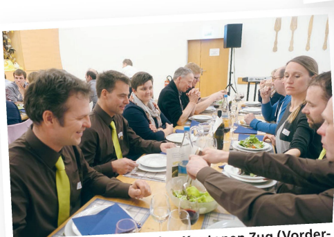
Die Delegationen aus den Kantonen Zug (Vordergrund) und Solothurn (Hintergrund).