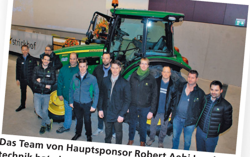
Das Team von Hauptsponsor Robert Aebi Landtechnik hat eine tolle Maschinenshow organisiert.