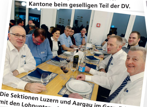
Die Sektionen für die Kantone Luzern und Aargau im Gespräch mit den Lohnunternehmern.