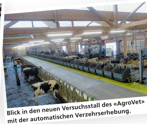
Blick in den neuen Versuchsstall des «AgroVet» mit der automatischen Verzehrerhebung.