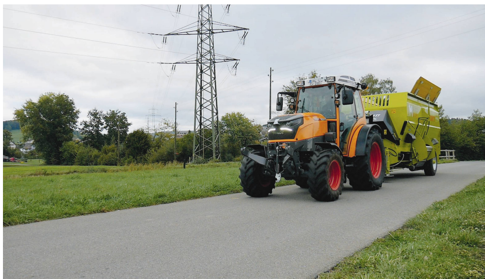
Es gilt: Alle Motorwagen und Motorräder müssen am Tag mit Licht fahren.

Je nach Licht- und Sichtverhältnissen sind auch grosse Fahrzeuge nicht ohne weiteres in ihren ganzen Dimensionen erkennbar. Alle Motorwagen und Motorräder müssen am Tag mit Licht fahren. Das gilt auch für landwirtschaftliche Fahrzeuge wie Traktoren, Mähdrescher, Zweiachsmäher, Bergtransporter und Feldhäcksler. Wer tagsüber ohne Licht fährt, riskiert eine Busse; sie beträgt CHF 40.–.