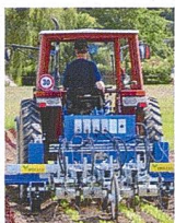
Titelbild: GPS-gesteuertes Hacken ist heute auch im Gemüsebau möglich.