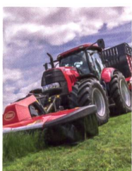
Futtererntetechnik, die keine Wünsche offen lässt.