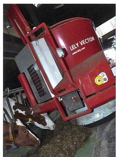
Titelbild: Die arbeitswirtschaftlichen Vorteile in grösseren Tierbeständen und die verbesserte Futteraufnahme durch die Kühe sprechen für die automatisierte Futtermischer.