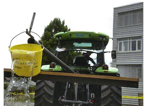
Die Solothurner hatten mit Traktor und Haken Wassereimer auf eine Waage zu befördern.