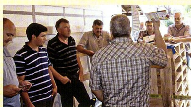
CZV – Weiterbildungskurse ab November 2015