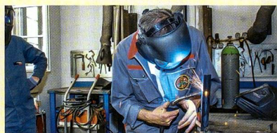
Schweisskurse ab Oktober 2015

Kurskosten: Mitglieder CHF 580.– (Nichtmitglieder CHF 630.–), abzüglich CHF 100.– vom Fonds für Verkehrssicherheit. Bei Abmeldung 14 Tage vor Kursbeginn wird ein Unkostenbeitrag von CHF 60.– erhoben. Nichterscheinen am Kurs berechtigt den SVLT, die vollen Kurskosten zu verlangen.