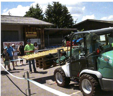
Mitmachen und Spass standen bei den Schaffhausern im Vordergrund.