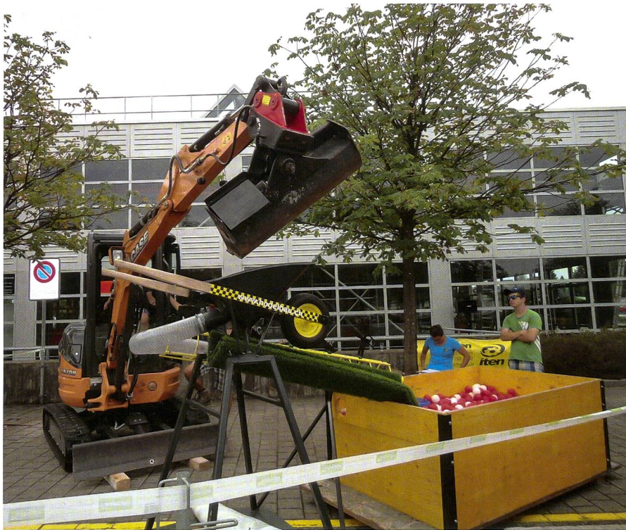
Bälle mit einem Kleinbagger in die Schubkarre manövrieren mussten die Zuger an ihrem Traktorengeschicklichkeitsfahren.

Erfreulich hohe Beteiligungen an den kantonalen Traktorengeschicklichkeitsfahren (TGF) von jeweils über hundert Fahrern verzeichneten die Schaffhauser und Zuger, über siebzig die Solothurner. Für die Schweizer Meisterschaft 2016 sind die Erst- und Zweitklassierten der Kategorien Aktive und Junioren qualifiziert.