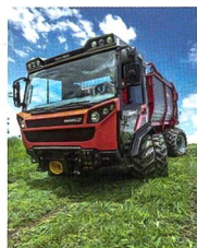
Titelbild: Muli T10 X-«Hybridshift» mit mechanischem und hydraulischem Fährantrieb.