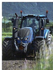
Titelbild: Fahrbericht zur neuen Valtra-T4-Serie.