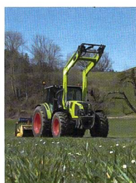
Titelbild: Claas Arion 420 – Allrounder mit Klasse im Praxiseinsatz.