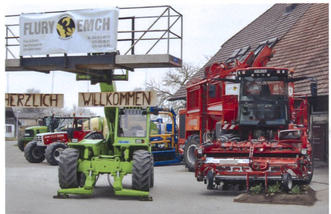
Der sechsreihige Zuckerrübenroder steht seit 2011 bei Flury & Emch im Einsatz.