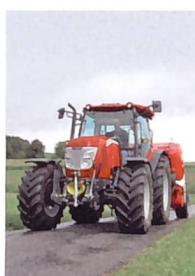
Titelbild: Fahrbericht zum McCormick X50.40