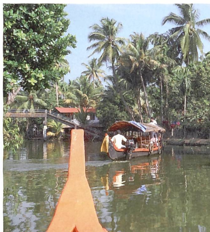
«Backwaters» im südindischen Kerala.