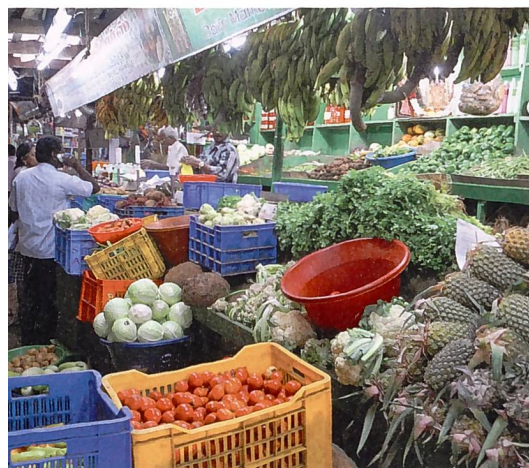
Grundversorgung mit Nahrungsmitteln, eine vornehme Aufgabe.

* Die Destination der offiziellen SVLT-Fach- und -Ferienreise 2014 ist Chile: Reisebericht und -prospekt erscheinen in der nächsten Ausgabe.