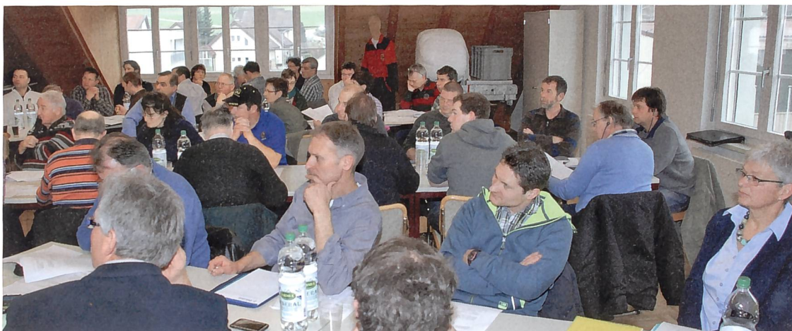
Konzentrierte Zuhörerschaft an der SVLT-Kaderkonferenz 2013 in Riniken.