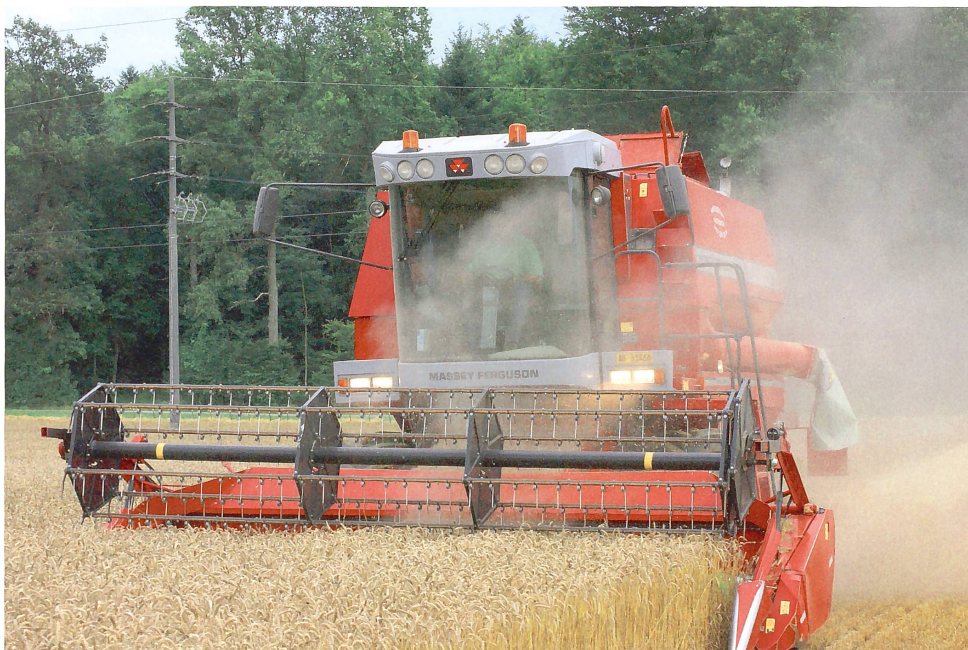
Der Mähdrusch – Die klassischste aller Lohnunternehmertätigkeiten