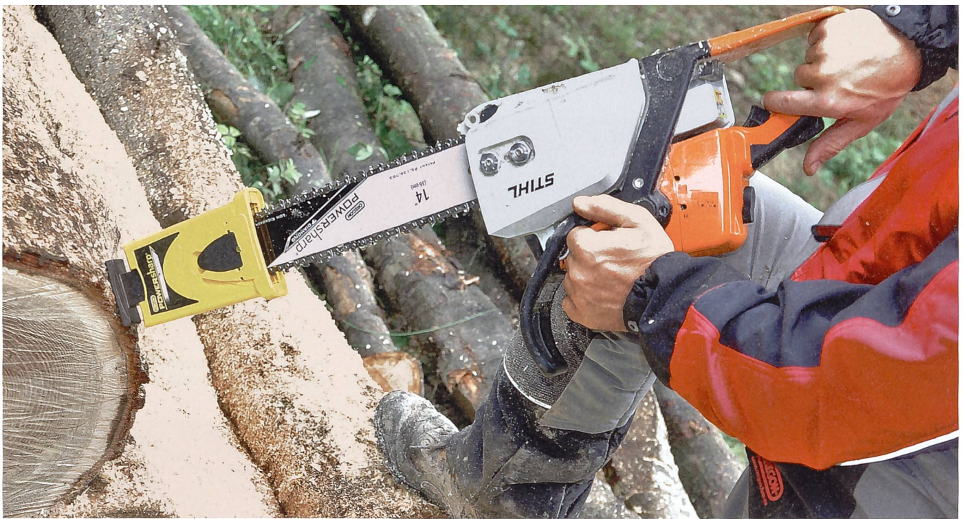
Der Fuss des Schärfergerätes wird gegen einen soliden Gegenstand gedrückt und die Säge mit voller Drehzahl laufen gelassen.