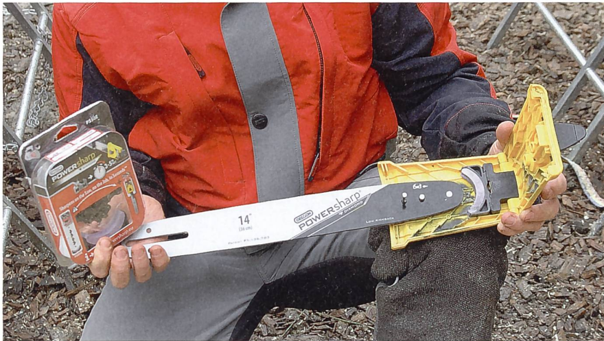
Das System besteht aus vier Elementen: der Sägekette, der Führungsschiene, der gelben Halterung und dem gebogenen Schleifstein.

Forstbetriebe fusionieren, wird auch weniger Ausrüstung eingekauft; das bekommen wir zu spüren, den harten Frankenkurs ebenso.