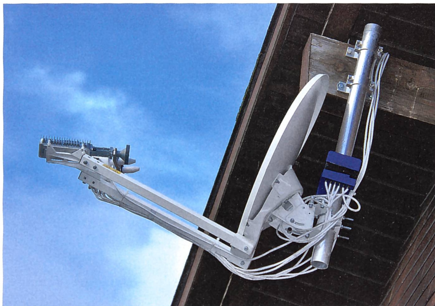
Die Satellitenantenne mit Sender und Empfängern (plus Modem und Rechner) werden für die Einrichtung der Internetverbindung über Satellit benötigt.