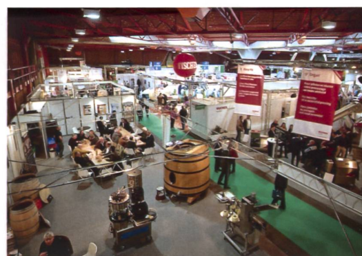
In Martigny werden neue Technologien des Weinbaus vorgestellt. (Bild: pd)