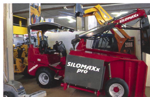
Die Swiss Expo besteht aus der Fachmesse für Agrotechnik (auf dem Bild nützliche Stallhelfer) und dem Internationalen Rinderwettbewerb.

Autobahn Richtung Lausanne-Nord, Ausfahrt Vennes oder Blécherette. Beschilderung «Beaulieu» folgen. Unterirdisches Parkhaus Beaulieu kostenpflichtig.