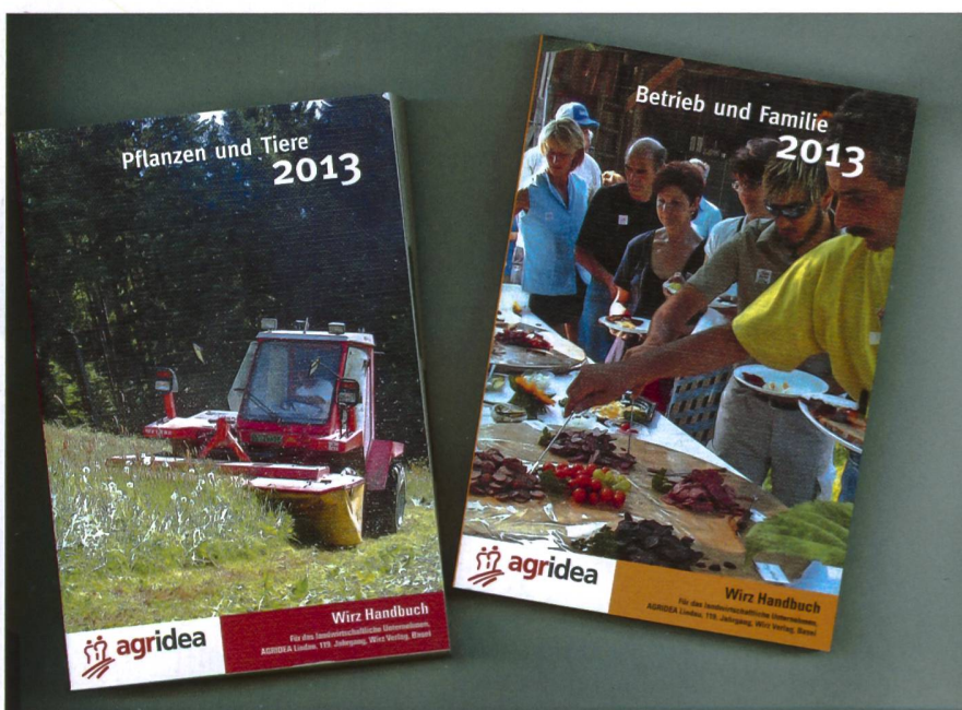
Am neuen Wirz Kalender haben rund 100 Fachleute mitgearbeitet.