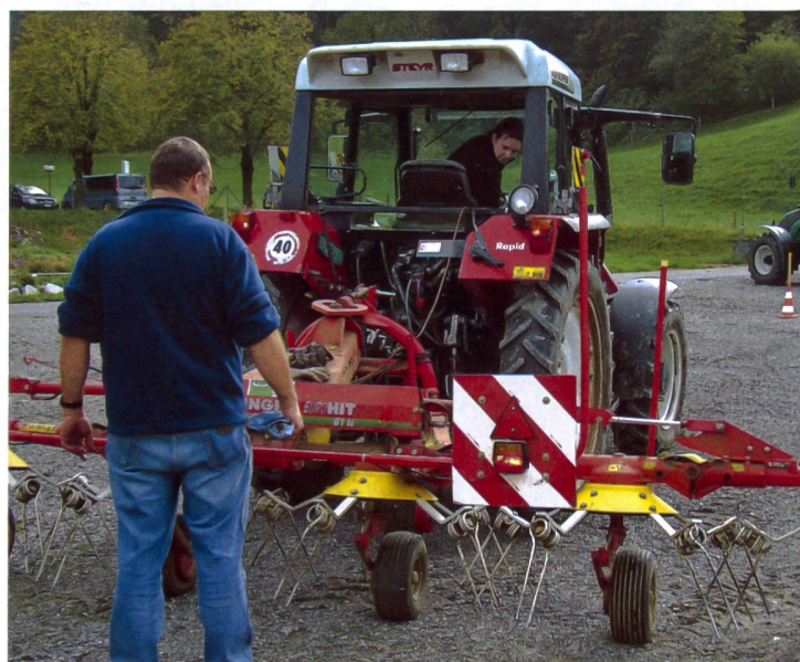
Am Kurs wird nicht nur gefahren, es werden auch Anbaugeräte an- und abgebaut.

Die Absolventinnen waren auch dieses Jahr mit den vom landwirtschaftlichen Zentrum Liebegg in Zusammenarbeit mit dem Aargauer Verband für Landtechnik durchgeführten Kursen sehr zufrieden. Die nächsten Kurse finden im April 2013 statt. Informationen dazu finden sich unter www.liebegg.ch oder www.avlt.ch . Hansjörg Furter, LZ Liebegg