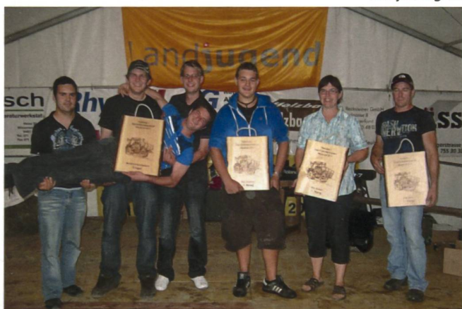
Die Sieger lassen sich feiern.