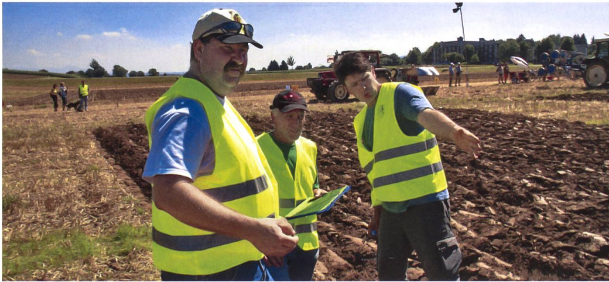
Das diesjährige Traktorenfest findet am 20. und 21. August in Frauenfeld statt.