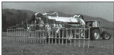
Fassverteiler passt an jedes Vakuum- oder Pumpfass.

Die Ausbringungsmenge kann einfach eingestellt werden.