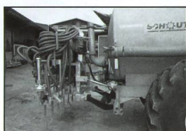
Für schwere Güllefässer mit Heckanbau.

Darum ist Kohli's Schleppschlauchverteiler einer der Meistgekauften .