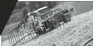
7 und 9 m leichte und kompakte Ausführung.

Das Herzstück von jedem Kohli Schleppschlauchverteiler ist der 1000-fach bewährte EXA-CUT Verteilerkopf von Vogelsang.