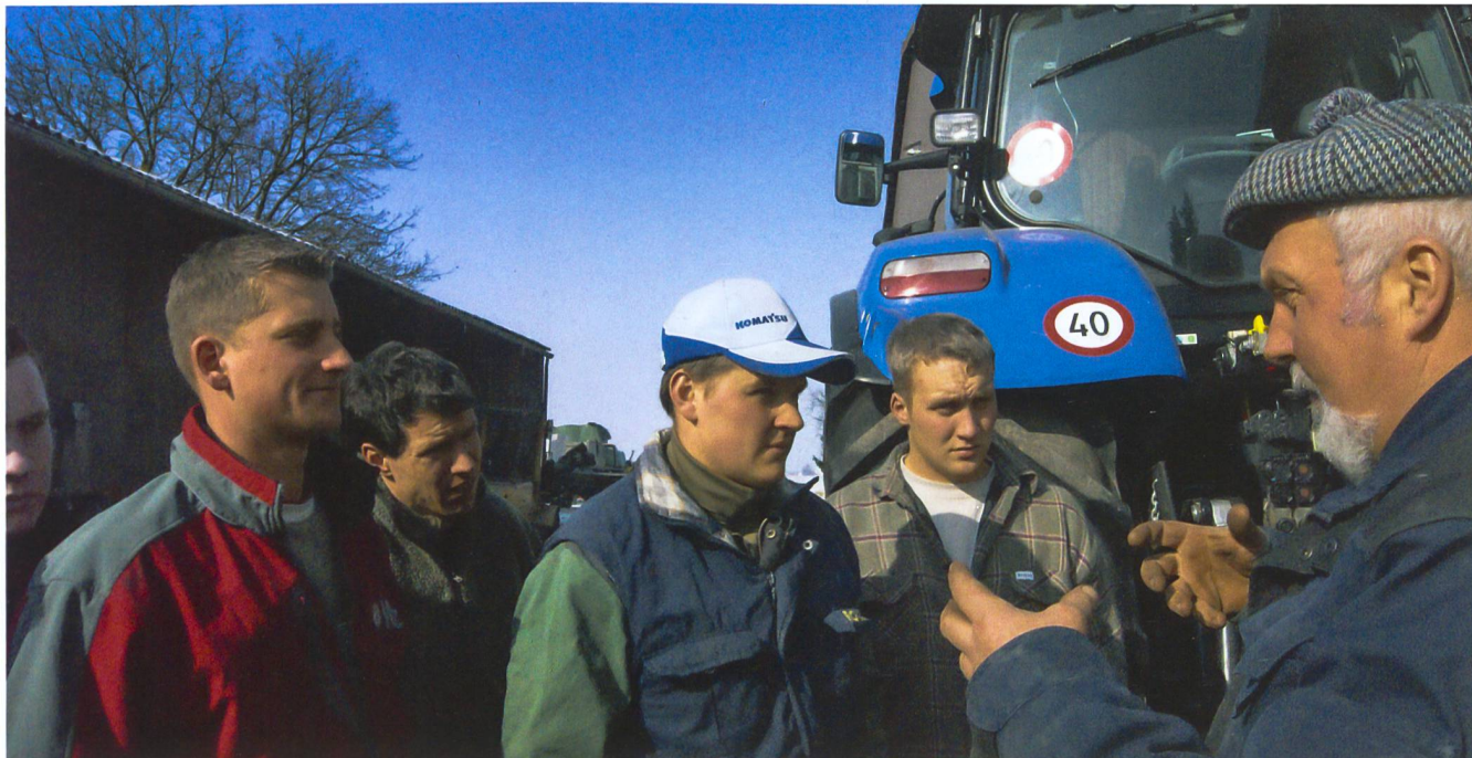
Maschinenkurs bedeutet spannende Vermittlung von Fachwissen und Know-how aus erster Hand.