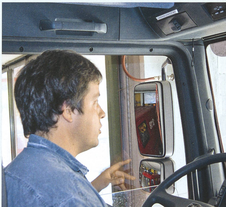
Für seine Mitglieder (und jene, die es werden wollen) lanciert der SVLT Weiterbildungskurse für Lastwagenchauffeure.

Detailinformationen zu allen Kursangeboten: www.strickhof.ch