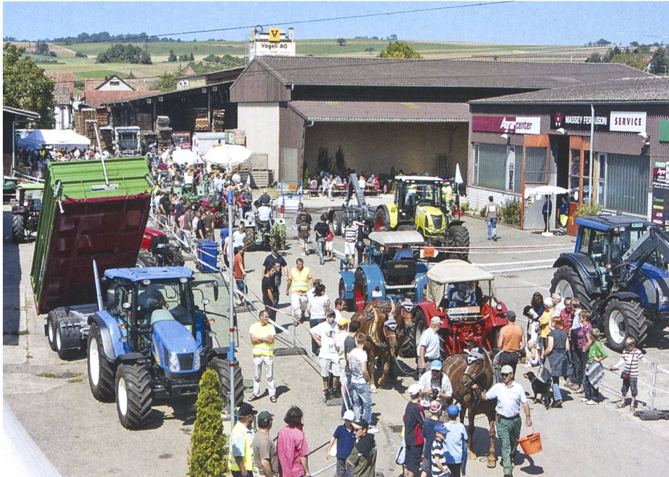
Perfekte Wettkampfbedingungen zum ersten Traktorenfest.