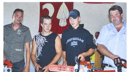
Im Mannschaftswettbewerb siegt die Sektion FR. Die Schaffhauser eroberten den zweiten, die Neuenburger den dritten Rang.