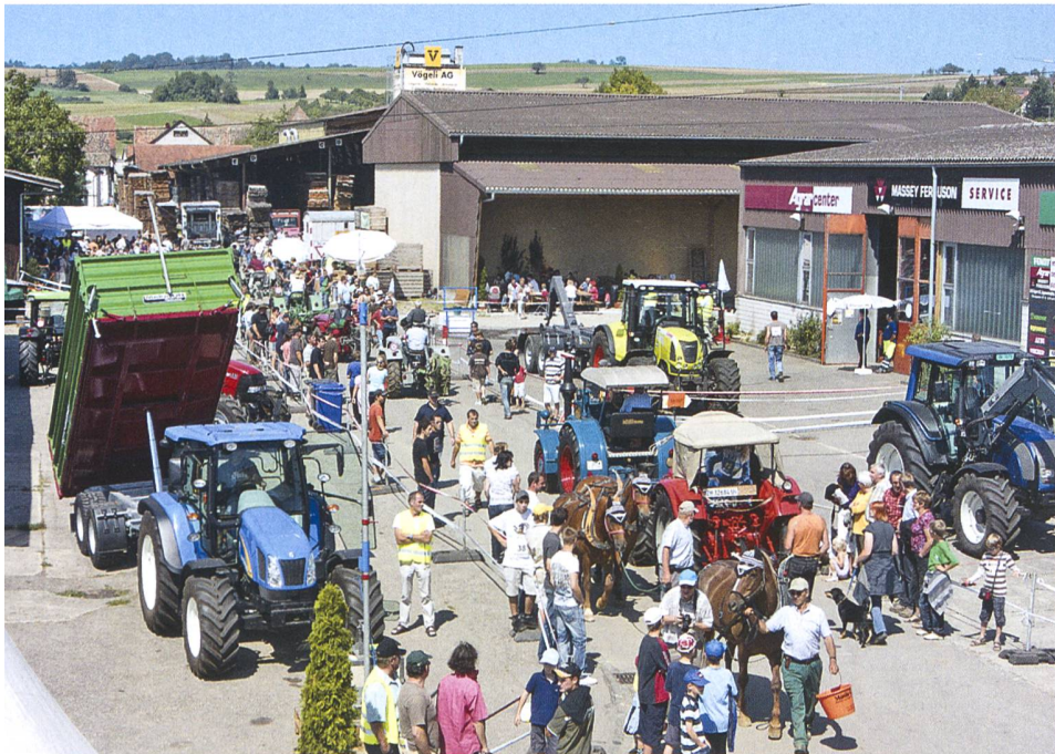
Perfekte Wettkampfbedingungen zum ersten Traktorenfest.