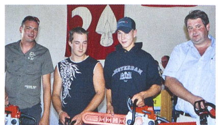
Im Mannschaftswettbewerb siegt die Sektion FR. Die Schaffhauser eroberten den zweiten, die Neuenburger den dritten Rang.