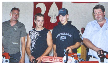
Im Mannschaftswettbewerb siegt die Sektion FR. Die Schaffhauser eroberten den zweiten, die Neuenburger den dritten Rang.