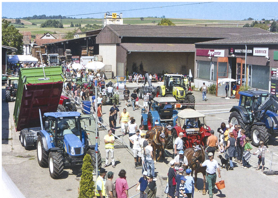
Perfekte Wettkampfbedingungen zum ersten Traktorenfest.