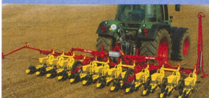
KLEINE Rübensägerät Präzision durch mechanische Vereinzelung