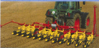
KLEINE Rübensäegerät Präzision durch mechanische Vereinzlung