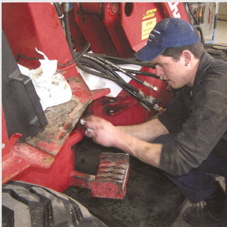
Weiterbildung: Kostbare Investition in die Zukunft.