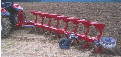
Flachpflug SUIRE Minimale Bodenbearbeitung, schonende Feldarbeit.