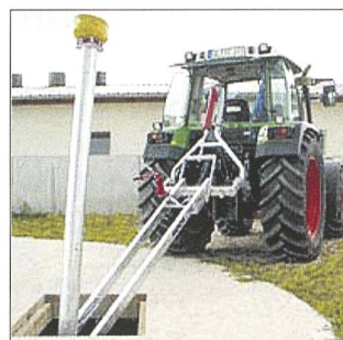
Einziger Hersteller von JUMBO-Mixern: Mixer ab 90 PS mit extrem hoher Rührwirkung

kanal- oder Slalomsystem – das Sortiment der Firma Reck umfasst starre und einschenkbare Zapfwellen-Rührwerke, Elektro- und Spaltenmischer für Rinder- und Schweinespalten in unterschiedlichen Längen und Leistungsklassen. Die Erkenntnisse von kundenindividuellen Spezialanfertigungen fliessen bei der Firma Reck stets in die Serienproduktion mit ein. Durch ausserordentliche Rühr- und Mischleistung ist die Firma Reck europaweit Marktführer.