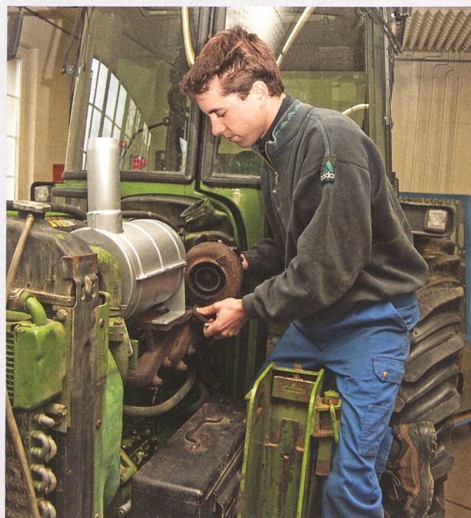
Es ist nie zu spät für eine gründliche Aus- und Weiterbildung am Kurszentrum in Riniken.