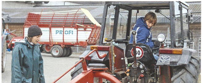
Intensives Üben sichert den Erfolg.

Der nächste Kurs findet am 2.6.2009 statt. Veranstalter: Strickhof, Schweizerischer Verband für Landtechnik SVLT Zürich. Anmeldung ab sofort an Strickhof, Kurssekretariat, Postfach, 8315 Lindau, Tel. 052 354 98 10, www.strickhof.ch oder www.svlt-zh.ch