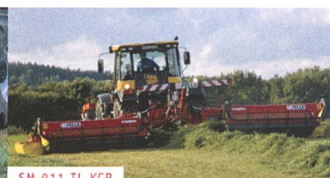
SM 911 TL KCB