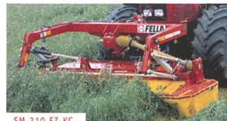
SM 310 FZ-KC