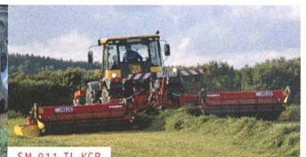
SM 911 TL KCB