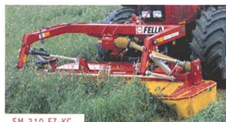
SM 310 FZ-KC

EZ Landmaschinen AG Bützbergstr. 70 CH- 4912 Aarwangen BE E-Mail: info@ezlandmaschinen.ch www.ezlandmaschinen.ch