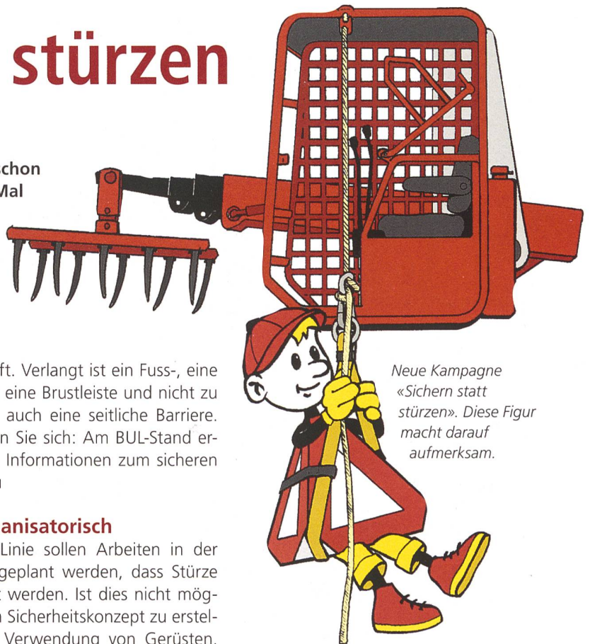
Neue Kampagne «Sichern statt stürzen». Diese Figur macht darauf aufmerksam.

Per ersten Juli 2009 endet auch die Übergangsfrist für die Nachrüstung mit Heckmarkierungen. Diese sind zusammen mit den