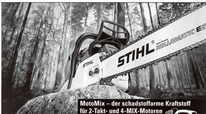
MotoMix – der schadstoffarme Kraftstoff für 2-Takt- und 4-MIX-Motoren

Seit über 30 Jahren Ihr kompetenter Partner wenn's um Sitzen geht!